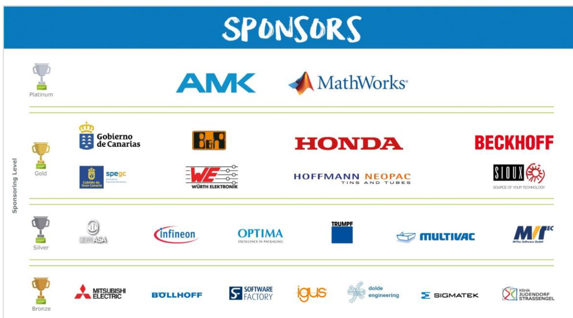
Bild 1: Übersicht: Sponsoren des Smart Green Island Makeathon 2019

Die örtliche Politik der Kanaren ist sehr angetan, dass die ITQ GmbH die Insel mit so einer Vielzahl an interessanten Unternehmen und großen Anzahl Young Talents ein ganz neues Image geben. Deshalb wird auch wie im letztes Jahr der Präsident von Gran Canaria, Antonio Morales Méndez, den Makeathon eröffnen.